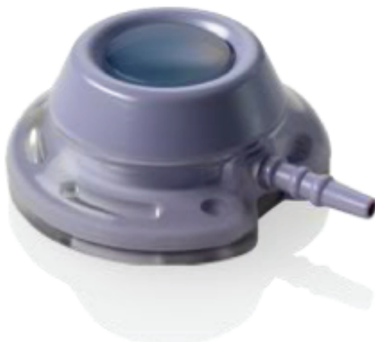
Afbeelding van een Port-a-Cath

Een Port-a-Cath is een systeem om makkelijk toegang te kunnen krijgen tot uw vaatstelsel. Het is een implanteerbaar apparaat dat in verbinding staat met een grote ader (vena cava) in het lichaam. Een Port-a-Cath bestaat uit een injectiekamer, een soort reservoir dat onder de huid wordt geplaatst, en hieraan vast een dun rubber slangetje dat tot in de vena cava wordt gebracht. Een Port-a-Cath kan gebruikt worden om medicijnen toe te dienen, maar ook om bloed af te nemen. Dit is erg handig voor patiënten die lastig te prikken zijn. Bij het toedienen van medicatie wordt vaak een infuus aangesloten op de Port-a-Cath met een naaldje dat door de huid in de injectiekamer steekt.